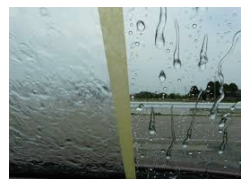
(左) 施工前 (右) 施工後